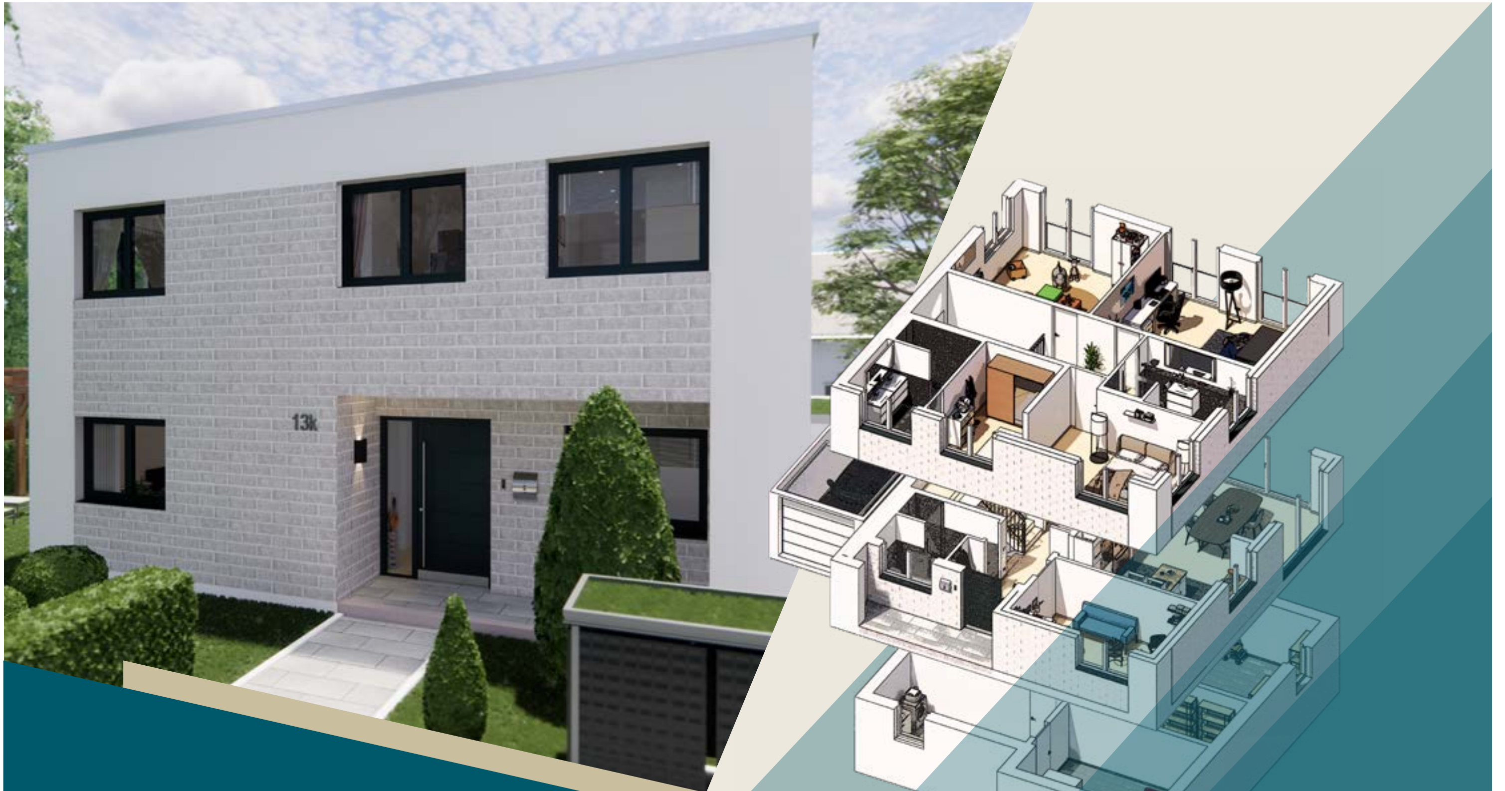
EINFAMILIENHAUS 43 Grosse Einberg 13k