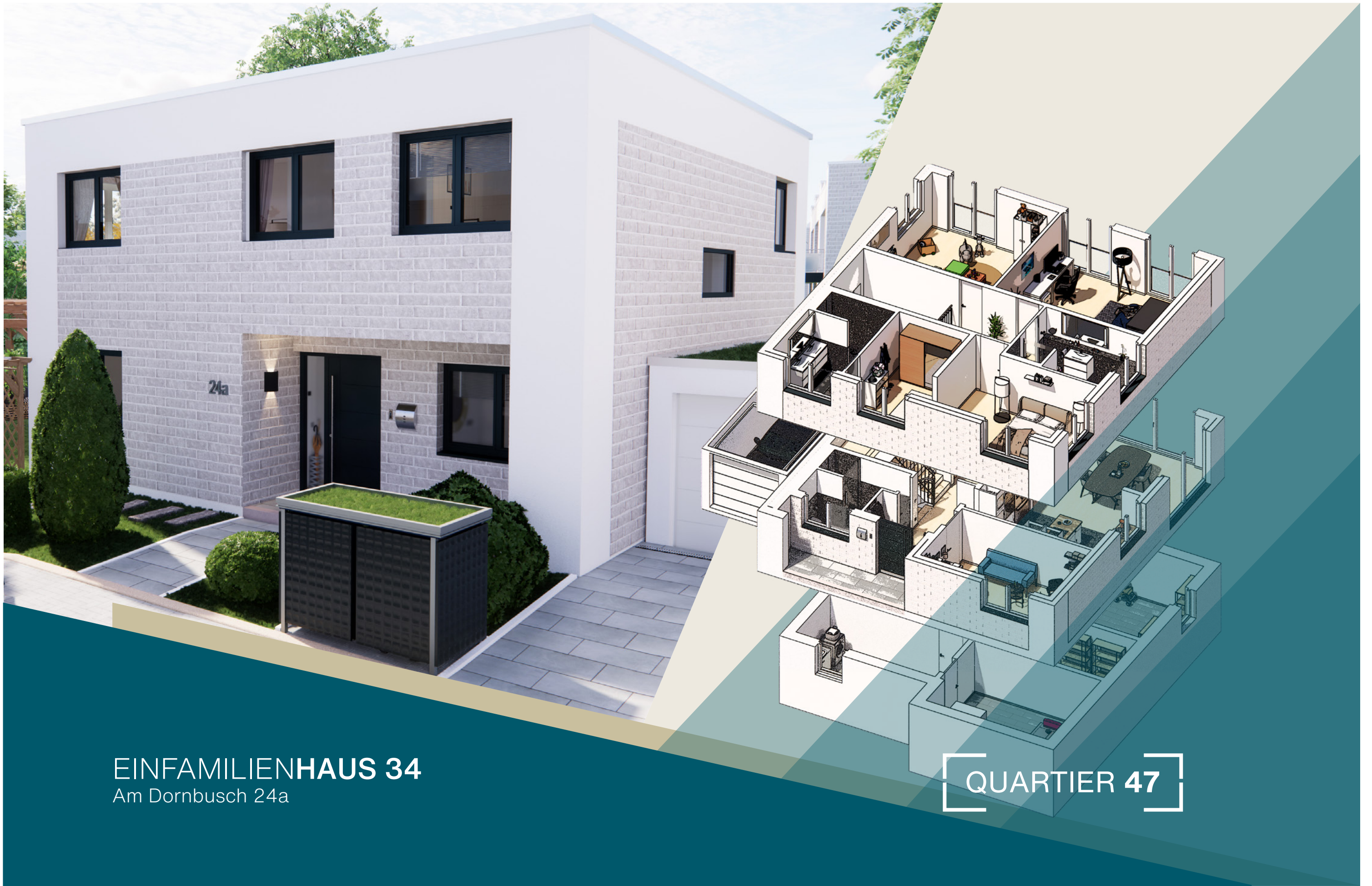
EINFAMILIENHAUS 34 Am Dornbusch 24a