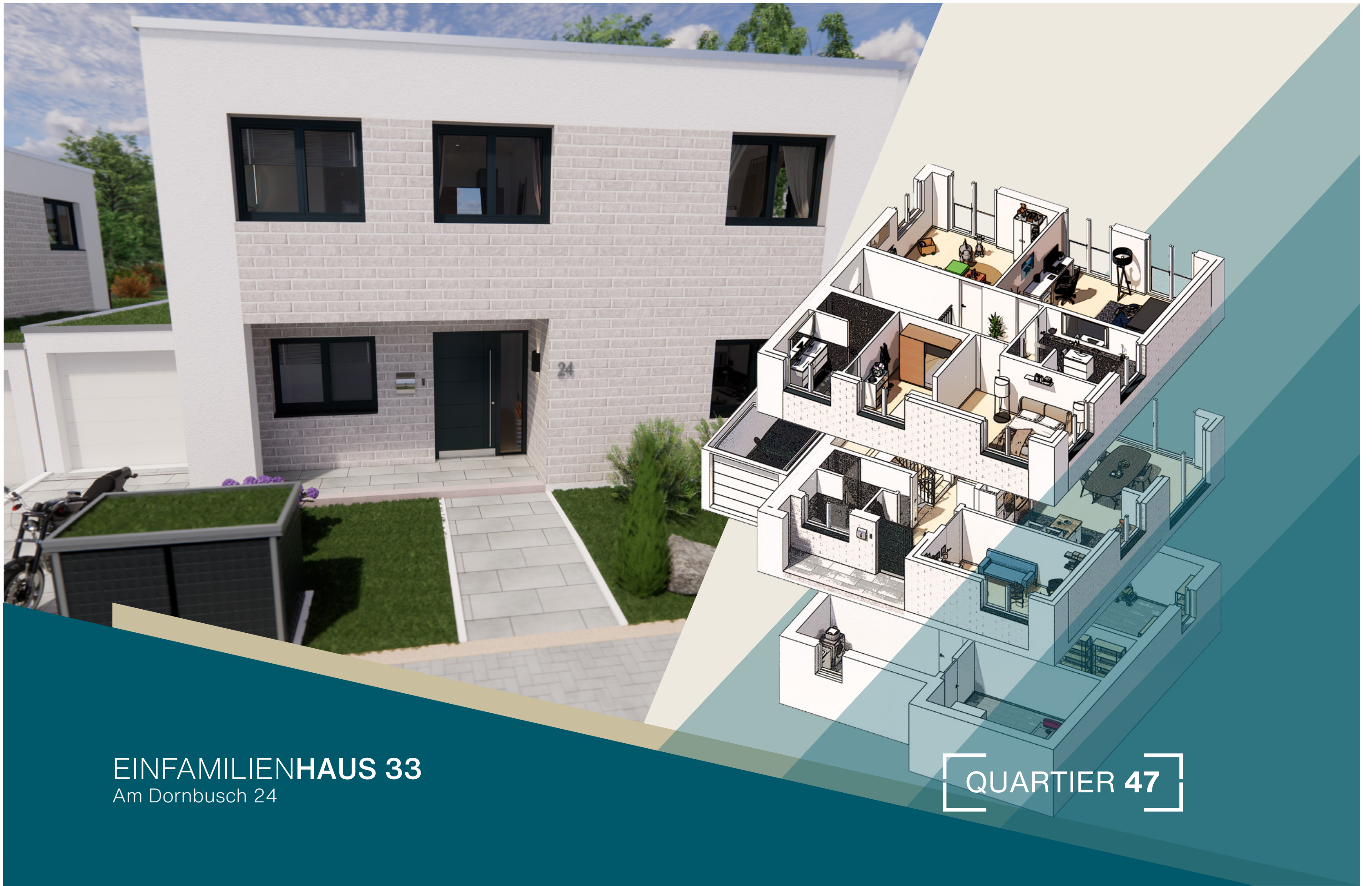
EINFAMILIENHAUS 33 Am Dornbusch 24